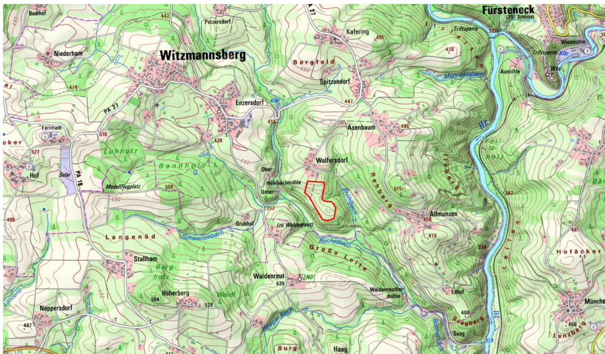
Übersichtskarte: Topografie ROT: Plangebiet (BayernAtlas 2024, nicht maßstäblich)

Das Plangebiet findet sich im Süden am Rande der Gemeinde Witzmannsberg, etwa 1,5 km südöstlich von dessen Siedlungszentrum. Die hügelige Gegend von Witzmannsberg besteht größtenteils aus kleineren Dorfgebieten, welche zumeist von weitläufigen Acker- und Grünlandflächen umgeben sind. Im gesamten Gemeindegebiet und vor allem entlang der Ilz, welche die Gemeinde von Osten her begrenzt, erstrecken sich immer wieder Waldflächen, die oftmals von kleineren Stehgewässern und Bächen begleitet werden.