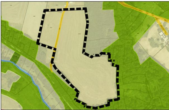
Auszug des Landschaftsplanes mit Rechtswirkung eines Flächennutzungsplanes

Mit der Änderung des Landschaftsplanes mit Rechtswirkung eines Flächennutzungsplanes von „Landwirtschaftliche Nutzfläche“ in ein „Sondergebiet für die Nutzung von Solarenergie“ sollen die Voraussetzungen für die Errichtung einer Freiflächen-Photovoltaikanlage im Rahmen einer nachhaltigen städtebaulichen Entwicklung geschaffen werden.