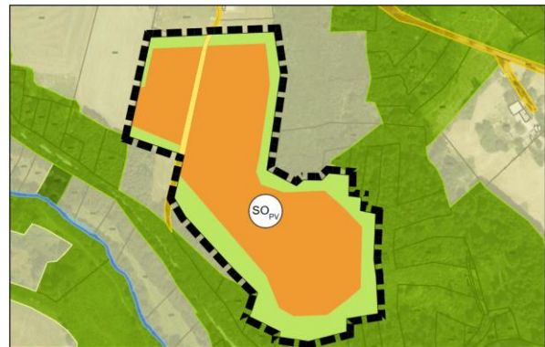
Auszug Planung, DB Nr. 18