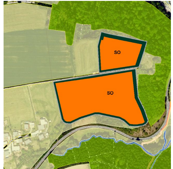
Abbildung 2: Ausschnitt aus dem Flächennutzungsplan Deckblatt 28 der Gemeinde Tittling

Arten- und Biotopschutzprogramm für den Landkreis Passau (räumlich zugeordnete Ziele des Kartenteils):