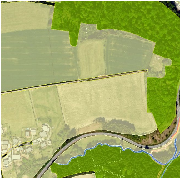
Abbildung 1: Ausschnitt aus dem rechtskräftigen Flächennutzungsplan der Gemeinde Tittling