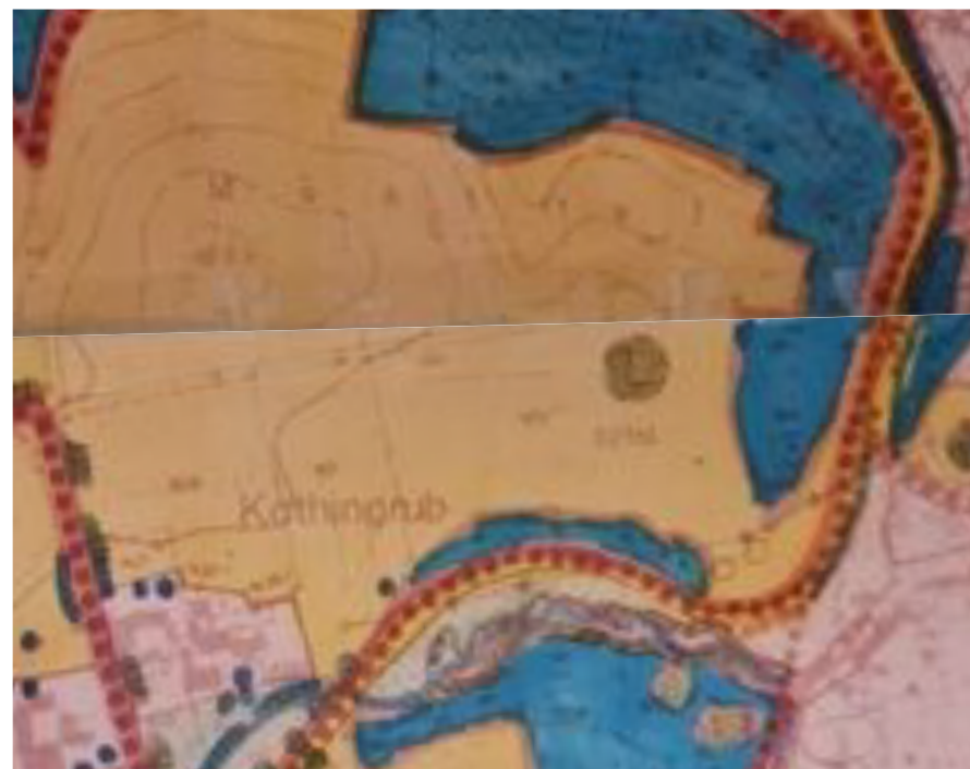
Landschaftsplan genehmigter Stand