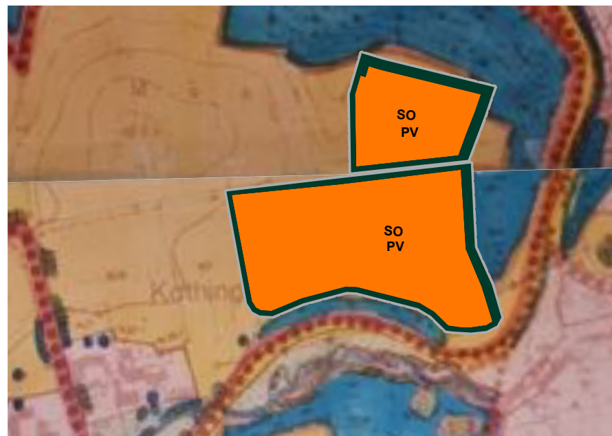
Landschaftsplan Deckblatt Nr. 27 - Bereich Solarpark