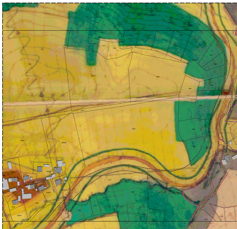
Flächennutzungsplan genehmigter Stand