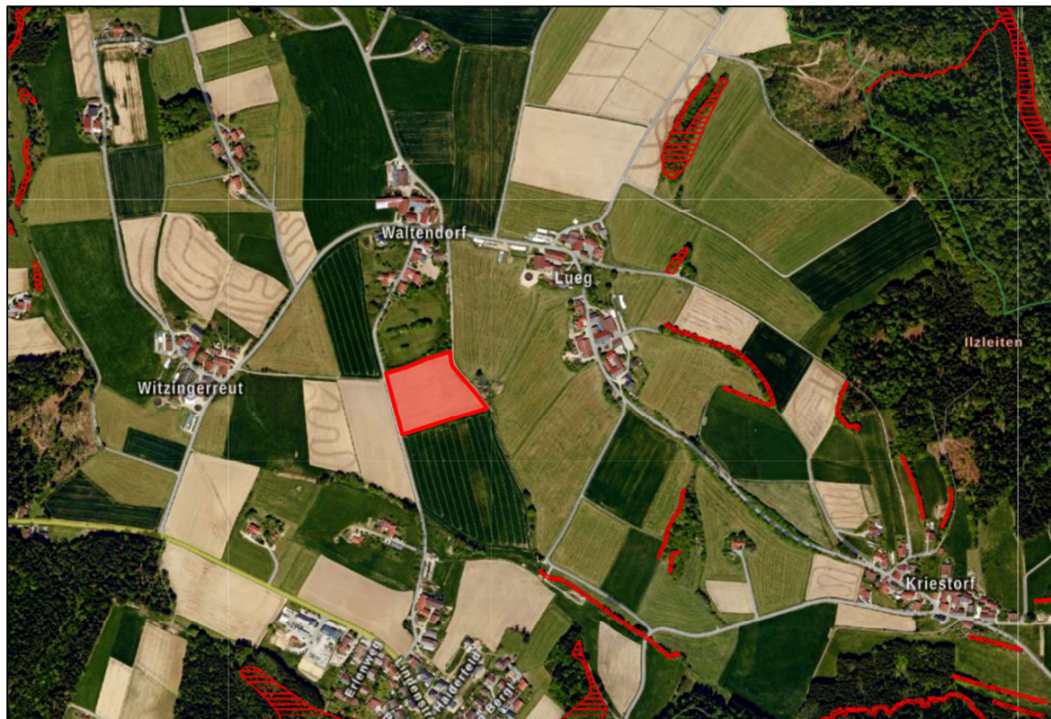
Abb. 2 Grober Umgriff des Geltungsbereichs im Luftbild (rot) und amtlicher Biotopkartierung. Ohne Maßstab.