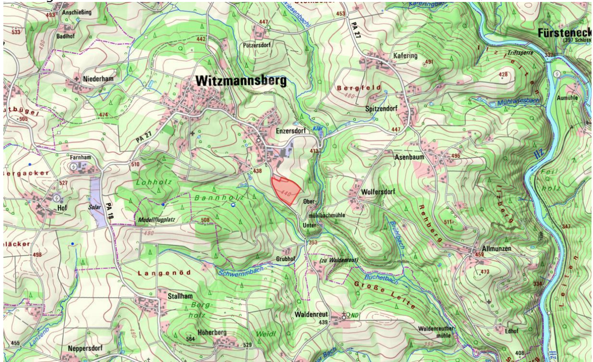
Übersichtskarte: Topografie ROT: Plangebiet (BayernAtlas 2024, nicht maßstäblich)

Die im Norden befindliche Lagerfläche liegt außerhalb des Geltungsbereiches. Direkt im Osten grenzen weitere landwirtschaftlich genutzte Areale mit einzelnen Gehölzkomplexen an die Eingriffsfläche. Im Süden sowie im Osten verlaufen die Waldflächen des „Bannholz“.