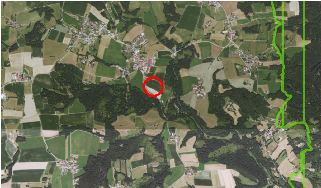
Regionalplan: Donau-Wald (12)

[...] „Nutzung regenerativer Energien ist ein wichtiges Element des Klimaschutzes und spielt für eine zukunftsfähige Energieversorgung eine bedeutende Rolle. In der Region Donau-Wald leisten die erneuerbaren Energieträger Wasser, Sonne, Biomasse usw. bereits einen erheblichen Beitrag zur Energieversorgung. Diesen Beitrag gilt es zu erhöhen, wobei zu beachten ist, dass die Leistungsfähigkeit des Naturhaushaltes erhalten, das Landschaftsbild nicht über Gebühr belastet und andere fachliche Belange (z.B. Wasserwirtschaft, Denkmalschutz etc.) entsprechend berücksichtigt werden. Die Regionalplanung will durch eine integrierte fachübergreifende Koordinierung, die mit der verstärkten Nutzung erneuerbarer Energieträger verbundenen Raumansprüche aufeinander abstimmen und Nutzungskonflikte vermeiden.“